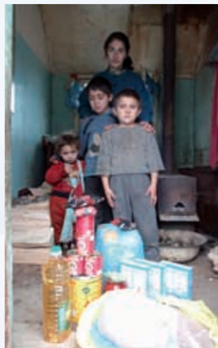
Goede voeding is van groot belang.