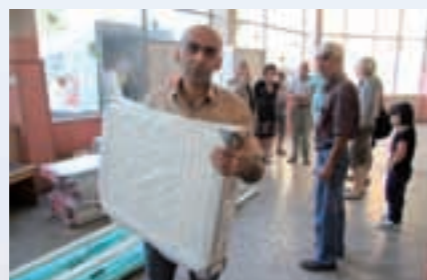
Bij de dovenschool zitten ze er nu warmpjes bij.

Met steun van het Stanislascollege Pijnacker dat gedurende de Stanislasdag maar liefst 10.000 bijeen gaarde – dat was najaar 2010 – is in het najaar van 2011 een geheel nieuwe verwarming aangelegd in de school, waar de leerlingen de hele week intern vertoeven. Ze komen namelijk vanuit het hele land naar de hoofdstad Jerevan om goed onderwijs te krijgen. Heel veel kinderen le-