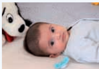
Met het geld van De Wisselbeker wordt allerlei goed werk gedaan.